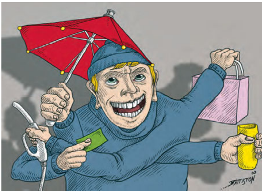
Immer mehr Dienstleistungen werden auf Kunden verlagert.

„Micro-Jobs, die gibt es auch noch“, erwidert Fiete und fügt hinzu,