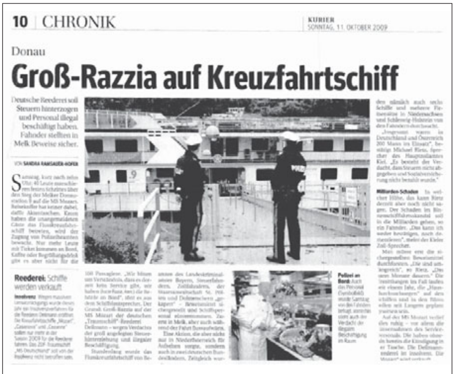
Die Staatsanwaltschaft macht ernst.

Verlierer sind die Besatzungen. Die Arbeitsverhältnisse werden gekündigt und die Arbeitslosigkeit beginnt.