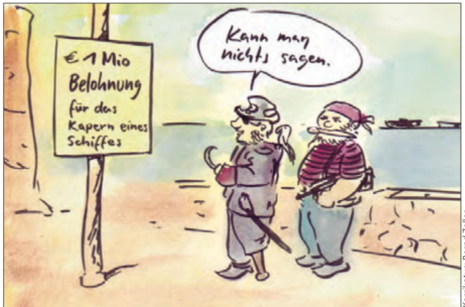
Karikatur: Bernd Zeller

Für Seeleute hat das Risiko, von Piraten angegriffen zu werden, trotz des Einsatzes von Kriegsschiffen kaum abgenommen, wie die jüngsten Kaperungen von Handelsschiffen durch Piraten zeigen. Die ITF bemüht sich deshalb, den Druck auf die internationale Völkergemeinschaft zu erhöhen, damit endlich die politische Situation in So-