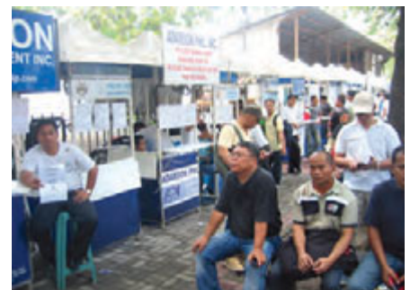
Bemannungsbuden in Manila

den großen Bemannungsagenturen so aus: Statt auf primitive Buden trifft man hier auf moderne Neubauten, die mit den neuesten technischen Errungenschaften ausgestattet sind. Neben der Heuervermittlung wird hier auch die Heuerabrechnung und darüber hinaus die Ausbildung für Kadetten betrieben. So kann beispielsweise die ausgelagerte deutsche Bemannungsagentur Marlow Navigation bis zu 1000 Schüler unterrichten. Diese