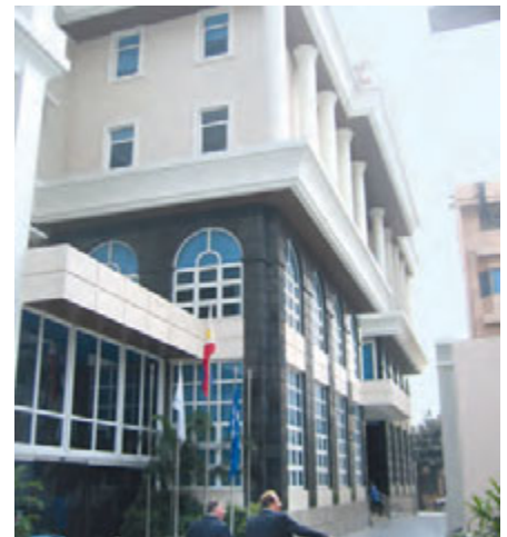
Große Bemannungsagenturen präsentieren sich, wie hier Marlow Navigation.

Im Gegensatz zu diesem „Budenzauber“ sieht die Jobvermittlung bei